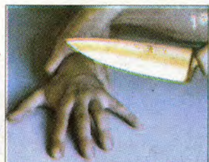
Lånehajarna hotade skära av ett finger.

Lånehajjar som lånar ut pengar på toaletten - där ingen kamera kan fånga dem på bild. Prostituerade som raggat kunder på kasinot. Nu avslöjar SVT:s "Uppdrag granskning" nya skandaler på statens kasinon.