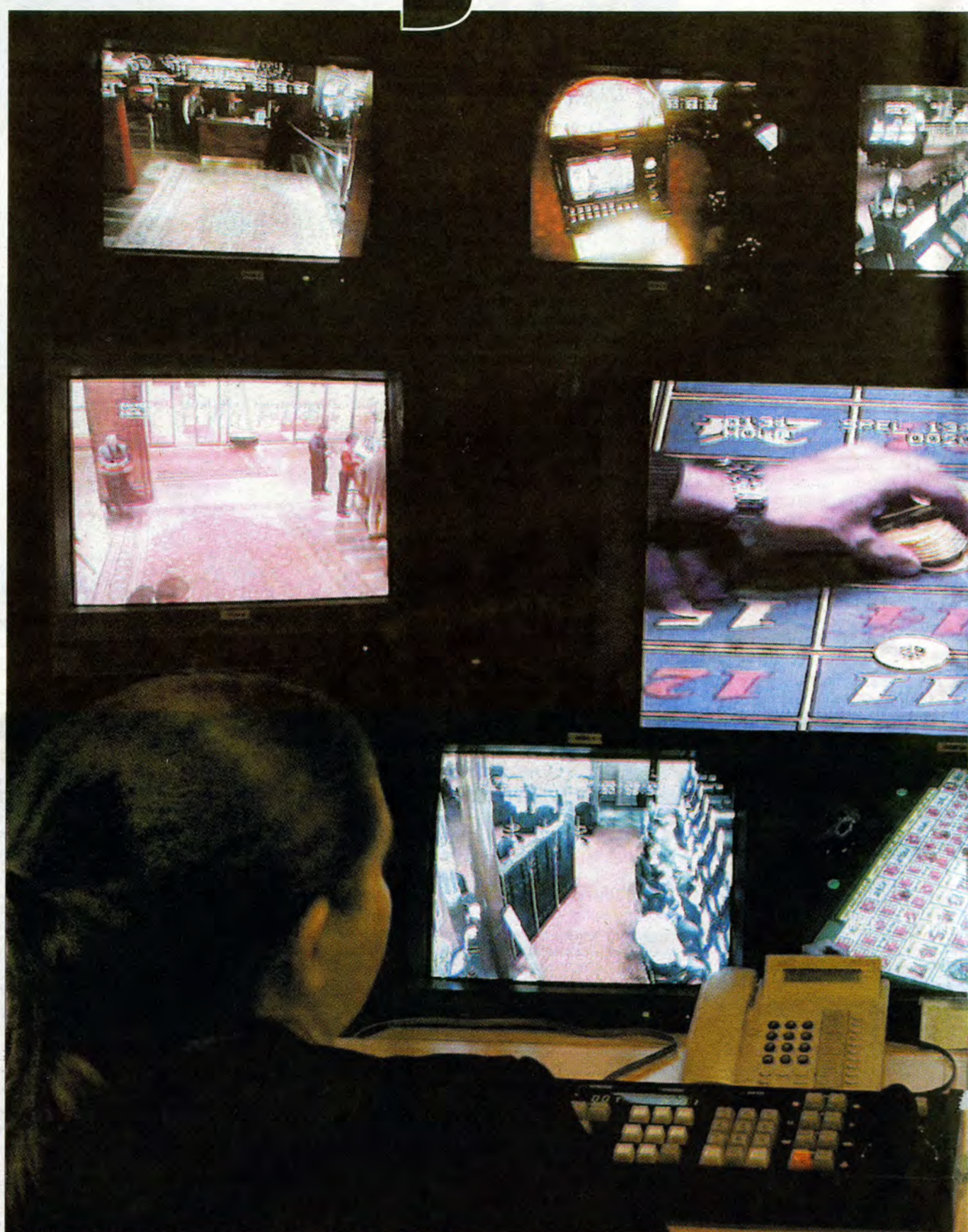
ÖVERVAKADE - MEN INTE ÖVERALLT Trots rigorösa säkerhetsåtgärder och otaliga bevakningskameror på statliga Casino Cosmopol får man inte bukt med kriminaliteten. Prostituerade, lånehajjar, ficktjuvar, rånnare och bråkstakar hittar sina offer bland spelarna. I SVT:s "Uppdrag granskning" berättade en man om hur han och hans familj hotats när han inte kunde betala sina spelskulder.

Precis när de skulle börja skära sa en av männen att han fick en vecka till på sig.