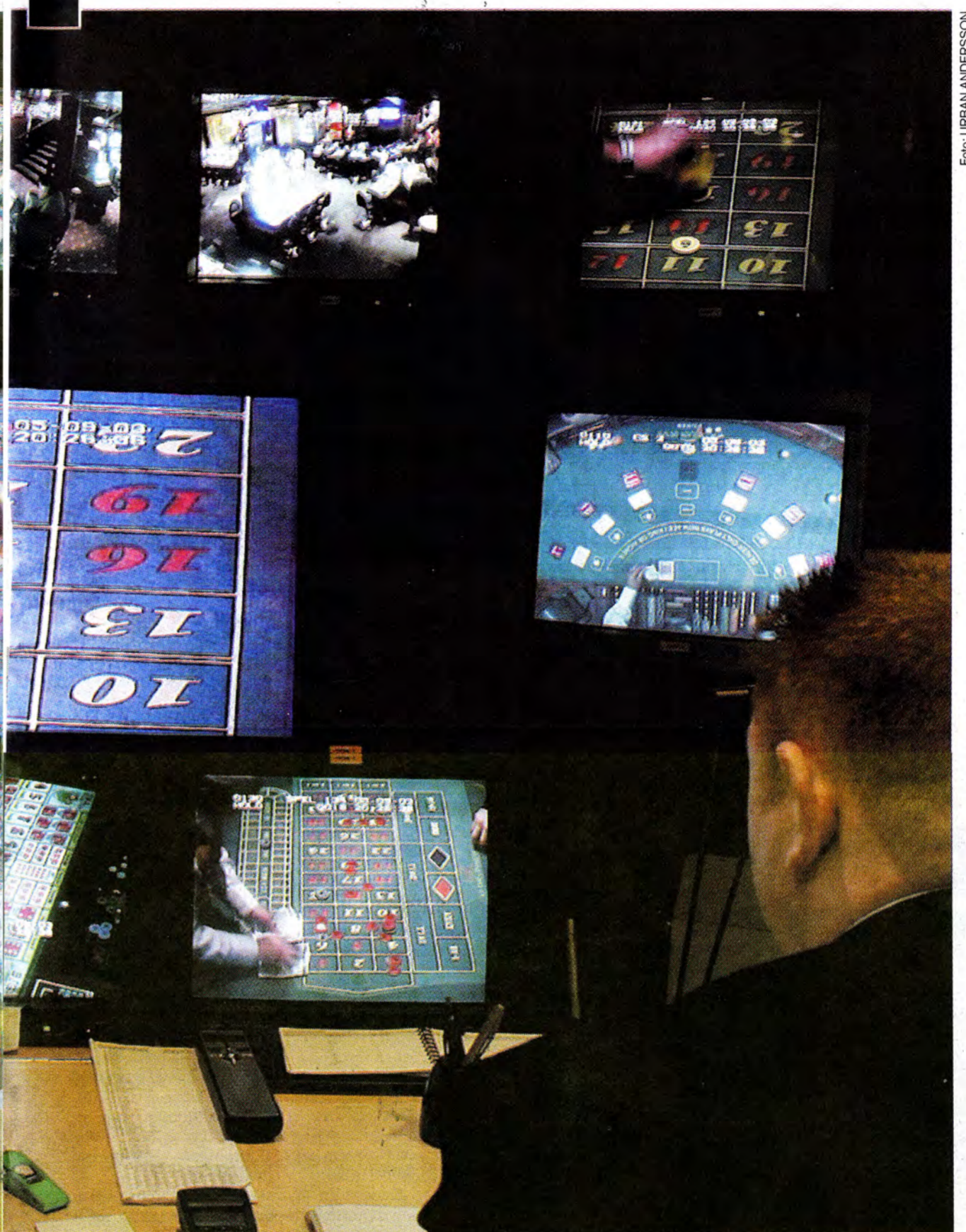
Ficktjuvar, rånnare och bråkstakar hittar sina offer bland spelarna. I SVT:s "Uppdrag granskning" berättade en man om hur han och hans familj hotats när han inte kunde betala sina spelskulder.